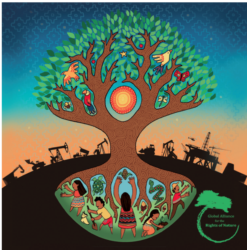
Figure 2. Pour de nouvelles relations entre humains et non humains

constitutive d'un « uni-monde » néolibéral et à ses logiques technico-économiques qui ne cessent de vouloir imposer un ordre rationnel et utile. Prendre soin du milieu, c'est au contraire rendre possible le déploiement de mondes multiples, l'existence d'un plurivers riche de relations signifiantes entre ses co-habitants (Escobar, 2018).