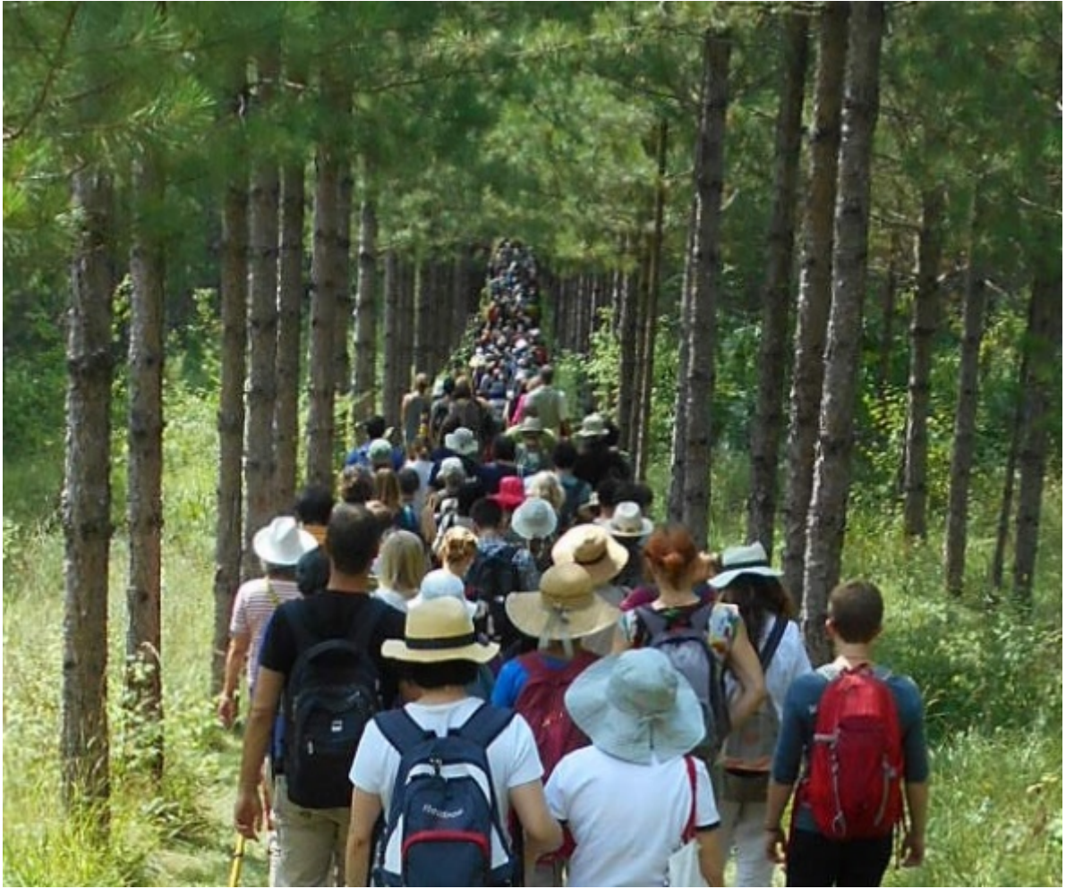
Fig. 1. Marche méditative en forêt

Je me promène dans une forêt, j'observe les arbres : certains sont très proches, d'autres respectent la distance qui les sépare du feuillage de l'arbre voisin : il y a une sorte de « timidité » des arbres qui se manifeste dans leur développement afin de laisser la place à l'autre, pour laisser pénétrer la lumière nécessaire aux petites plantes du sous-bois, aux insectes et aux autres animaux. Les arbres de la forêt adoptent un système complexe de communication et d'entraide sans lequel la forêt ne pourrait pas survivre ni se développer.