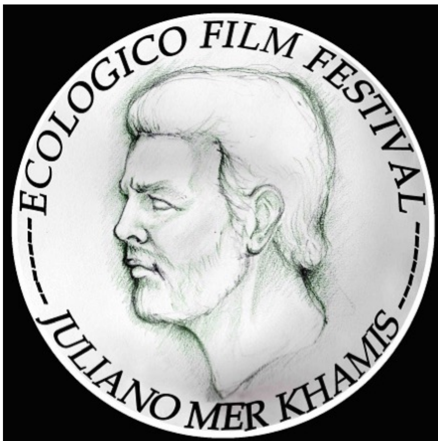
Premio intitolato a Juliano Mer Khamis

stranieri iscritti al Festival indica, evidentemente, che l'EIFF è ormai un festival riconosciuto a livello mondiale. Ne sono ulteriormente prova i patrocini internazionali riconosciuti al Festival. Inoltre ha stabilito gemellaggi con Festival prestigiosi come il Green Nation Festival di Rio de Janeiro, il Thessaloniki International Short Film Festival di Salonicco e il The Village Doc Festival di Milano.