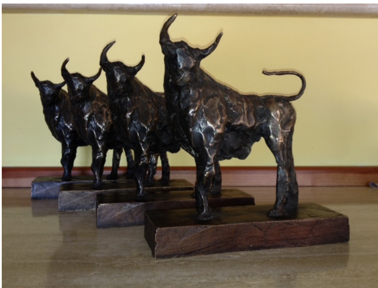
Statuette del Taurus in bronzo prima della premiazione (Eiff 2013 - Nardò)

occasione dei festeggiamenti per la sua ventesima edizione, ospiterà il festival durante tutta la manifestazione. Siamo certi che sarà una splendida cornice per un festival come l'Eiff che è fondato essenzialmente sull' "incontro". Perché così come il cinema è il luogo della condivisione di un film, il libro può essere il ponte che fa incontrare l'autore con il lettore. I progetti culturali finalizzati a sviluppare la presa di coscienza del pubblico esprimono una natura intrinsecamente "formativa". Ciò significa che avrebbero bisogno di specifici spazi dove, appunto, la cultura opera, vive e si rinnova. L'esperienza di questi anni ci porta a concludere che un progetto di trasformazione culturale come l'Eiff troverebbe compiutezza e senso in un contesto accademico e, pertanto, per garantirne la continuità sarà determinante stabilire dei rapporti di collaborazione con il Mondo dell'Università. Oltre ai giorni della manifestazione, l'Eiff potrebbe proporre durante tutto l'arco dell'anno delle rassegne di film su tematiche suggerite dai docenti per consentire agli studenti di effettuare degli approfondimenti sulle materie di studio. Ci auguriamo, quindi, di trovare presto un'Università che voglia abbracciare l'Utopia dell'Eiff.