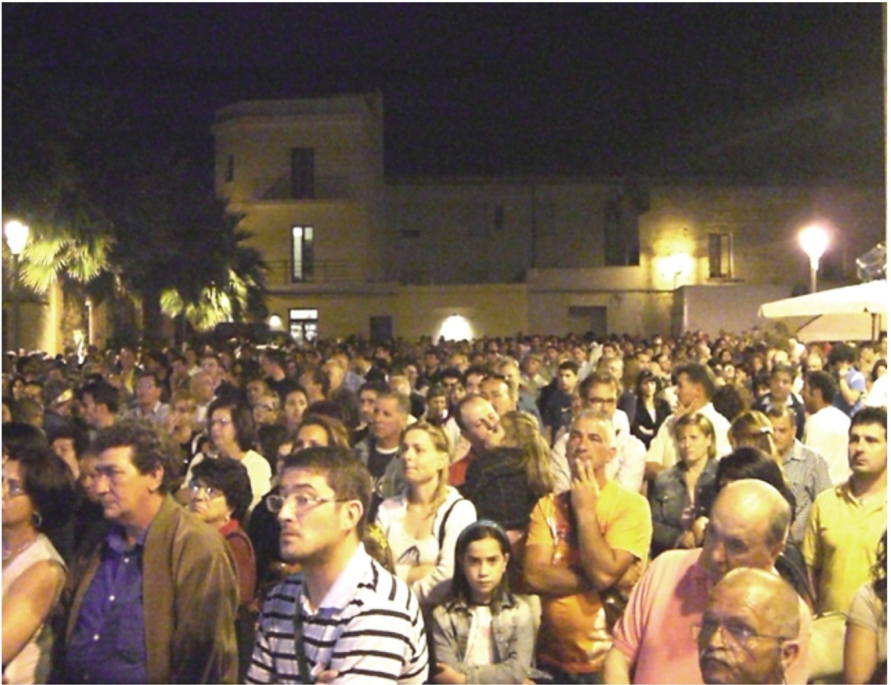
Proiezione in piazza - Eiff 2013 Nardò

La data di nascita ufficiale del cinema civile, si fa tradizionalmente risalire all'inizio degli anni Sessanta, con l'uscita del film di Francesco Rosi, Salvatore Giuliano del 1962. Il film è strutturato come un'inchiesta e, anche se ricostruisce i fatti avvalendosi di attori non professionisti, cerca di restituire la vicenda del bandito Giuliano in maniera abbastanza rigorosa. Il film fu un grande successo, raccolse un vasto consenso dal pubblico e importanti riconoscimenti dalla critica [16] e dal Mondo del Cinema [17] . Nello stesso anno vinse l'Orso d'argento al Festival di Berlino. L'anno successivo Rosi s'impegnò su un altro film, questa volta di denuncia, che allo stesso modo riscosse un grande successo: Le Mani sulla Città . Questo film, considerato un capolavoro del Cinema Italiano, vinse il Leone d'Oro a Venezia nello stesso anno. Da allora, il Cinema d'impegno Civile ha conosciuto, in particolare in Italia, un periodo di grande fermento creativo e produttivo, altri registi seguirono il solco tracciato da Francesco Rosi [18] , ma fino all'avvento delle nuove tecnologie digitali è sempre stato una nicchia con un numero limitato di autori e opere realizzate.