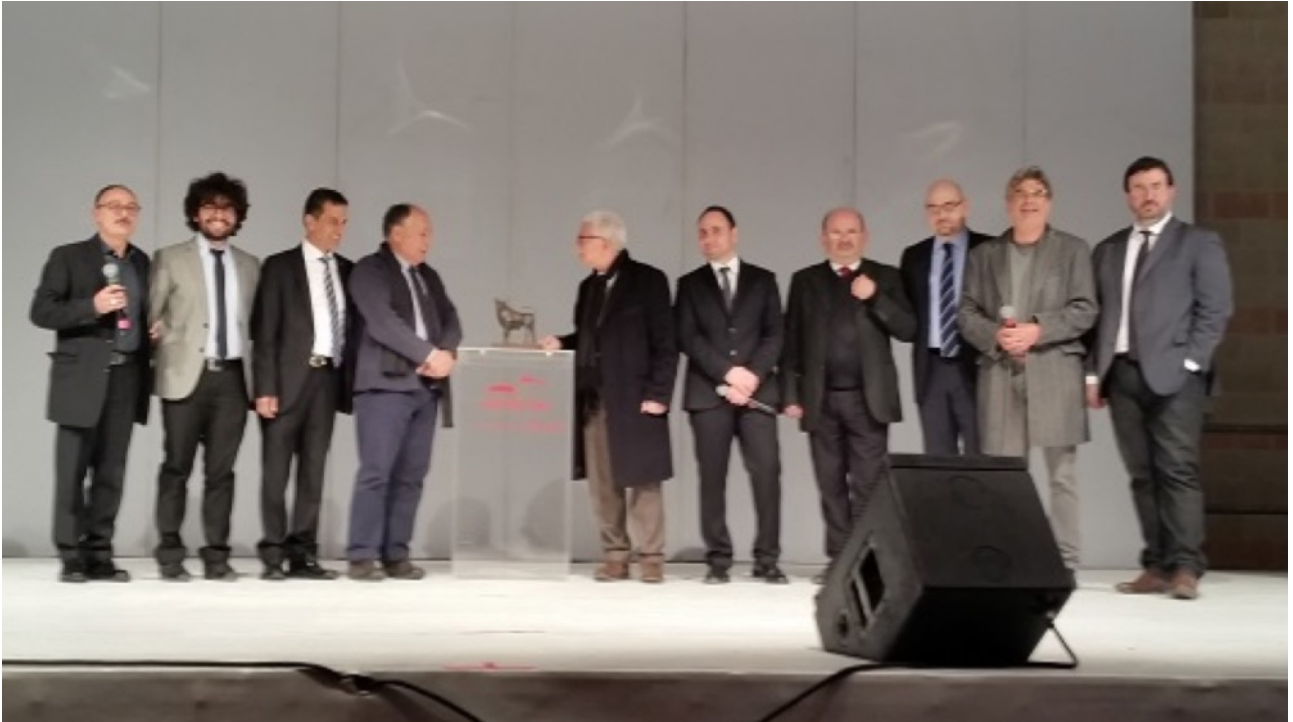
Serata di premiazione EIFF - Campi Salentina 2014

Il Festival promuove il dibattito nella società contemporanea sui temi cruciali della convivenza umana e promuove i valori dell'accoglienza e della solidarietà.