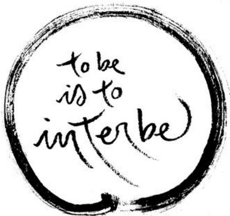
Thich Nhat Hanh, Calligraphie

L'artiste choisit de se faire « invisible », à travers une attitude d'ouverture extrême face aux phénomènes naturels qui peuvent se produire ou pas. L'humain participe ainsi au devenir incessant du cosmos et son regard évolue en rapport aux phénomènes observés : tout est relation, rien ne subsiste en tant que tel : nous sommes au cœur de ce que Thich Nhat Hanh nomme l'inter-être (inter-be) .