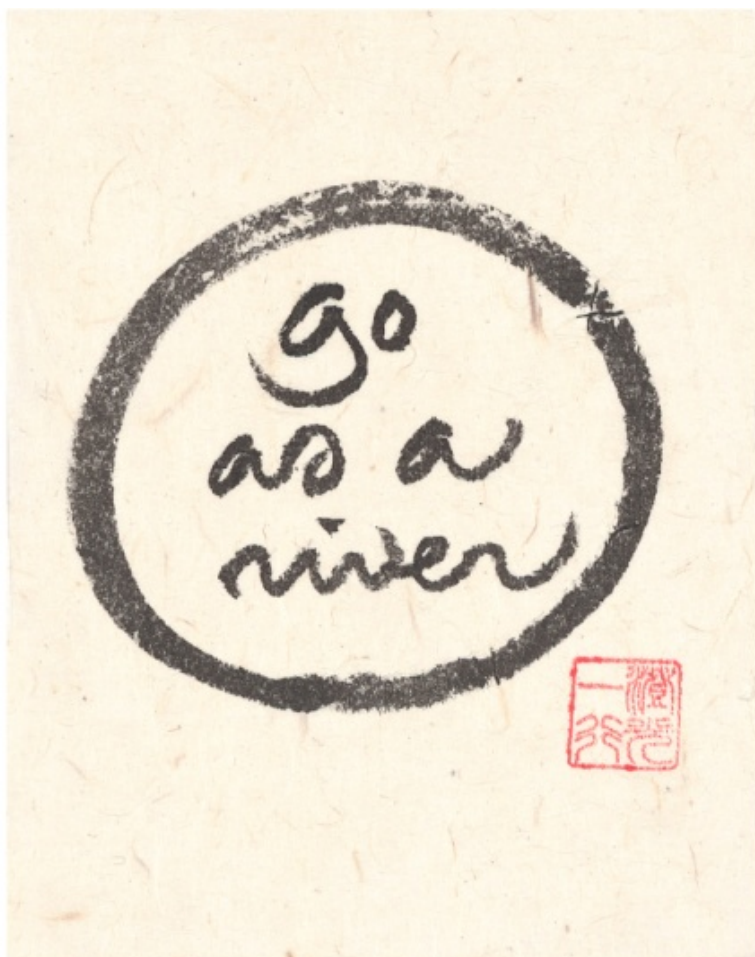
Thich Nhat Hanh, Calligraphie

Chacun de nous peut réaliser sa propre révolution individuelle, sa propre transformation intérieure. Il est plus que jamais nécessaire pour nous de réenchanter le monde , de s'étonner devant le miracle de la germination d'un grain de blé , devant le ciel étoilé.