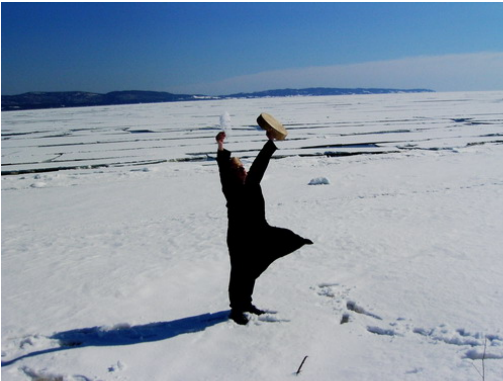
Luisella Carretta, Le désert de glace , Canada

Les peintures et performances de Luisella Carretta , une artiste italienne qui vit à Gênes, sont inspirées par l'observation du monde naturel et en particulier le vol des oiseaux : l'attitude fondamentale de l'artiste est marquée par un profond respect du non humain : l'œuvre est le fruit de longues attentes au sein du paysage afin de percevoir les trajets du vol des oiseaux dans le ciel.