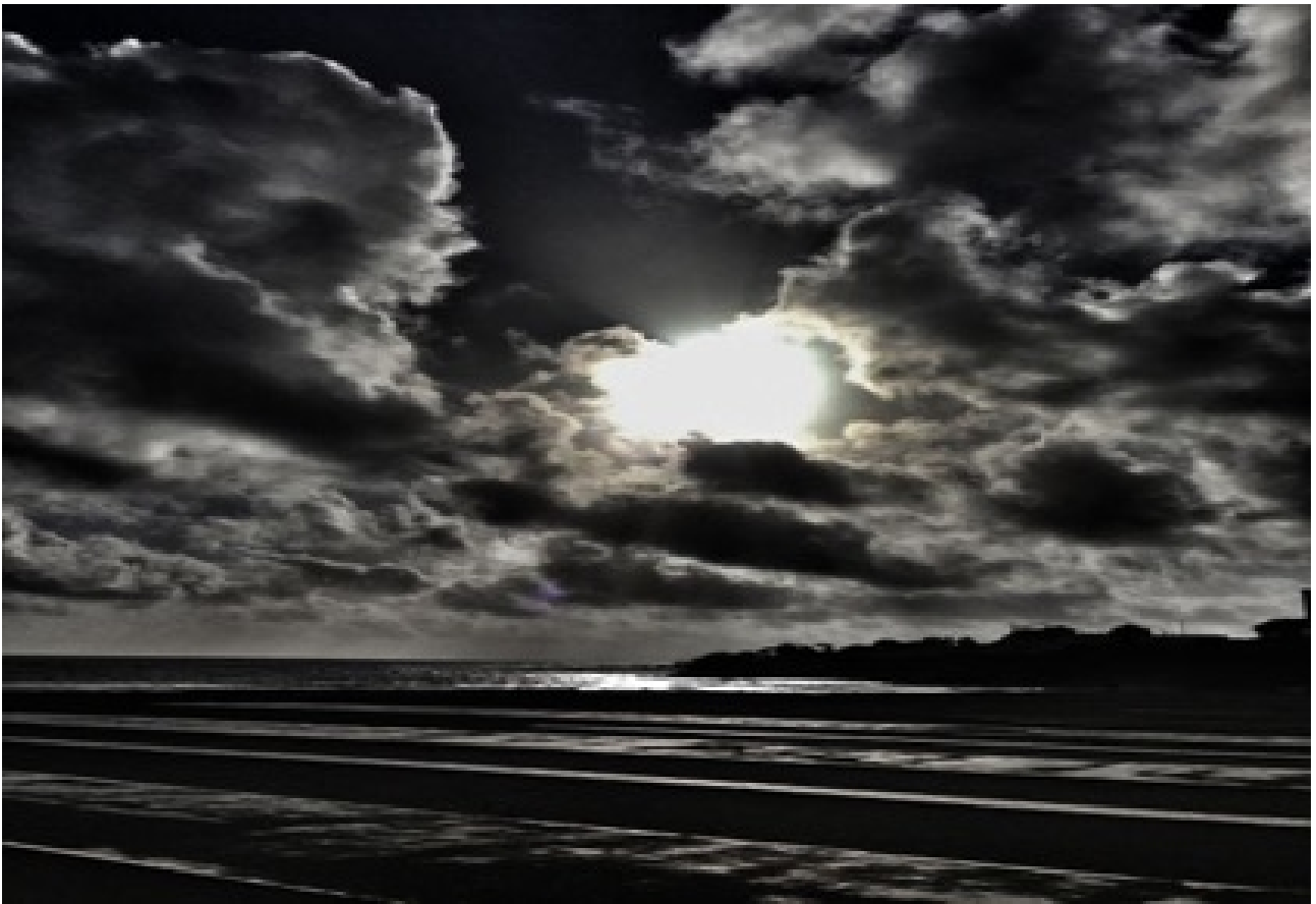
Lumières sans titre