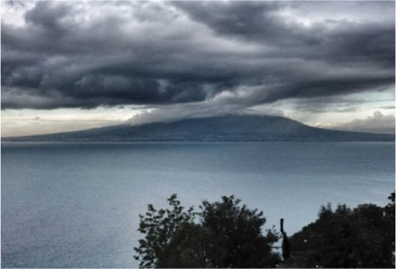
La lave et la mer

depuis les cavités de la terre vers le monde « ouvert » au-dessus. Tous ces éléments sont des exemples de la porosité métabolique du monde, exprimée parfaitement par le mot allemand traduisant « métabolisme », Stoffwechsel : littéralement, un échange de matières.