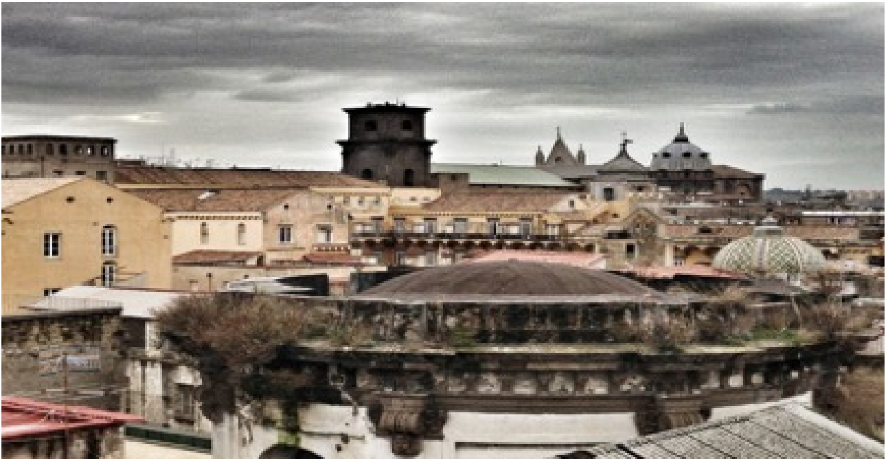
L'esprit du lieu

et de porosité. Il concerne l'éruption de 79 av. J-C qui a affecté un vaste territoire au pied du mont Vésuve, modifiant la vie et le paysage de la région napolitaine.