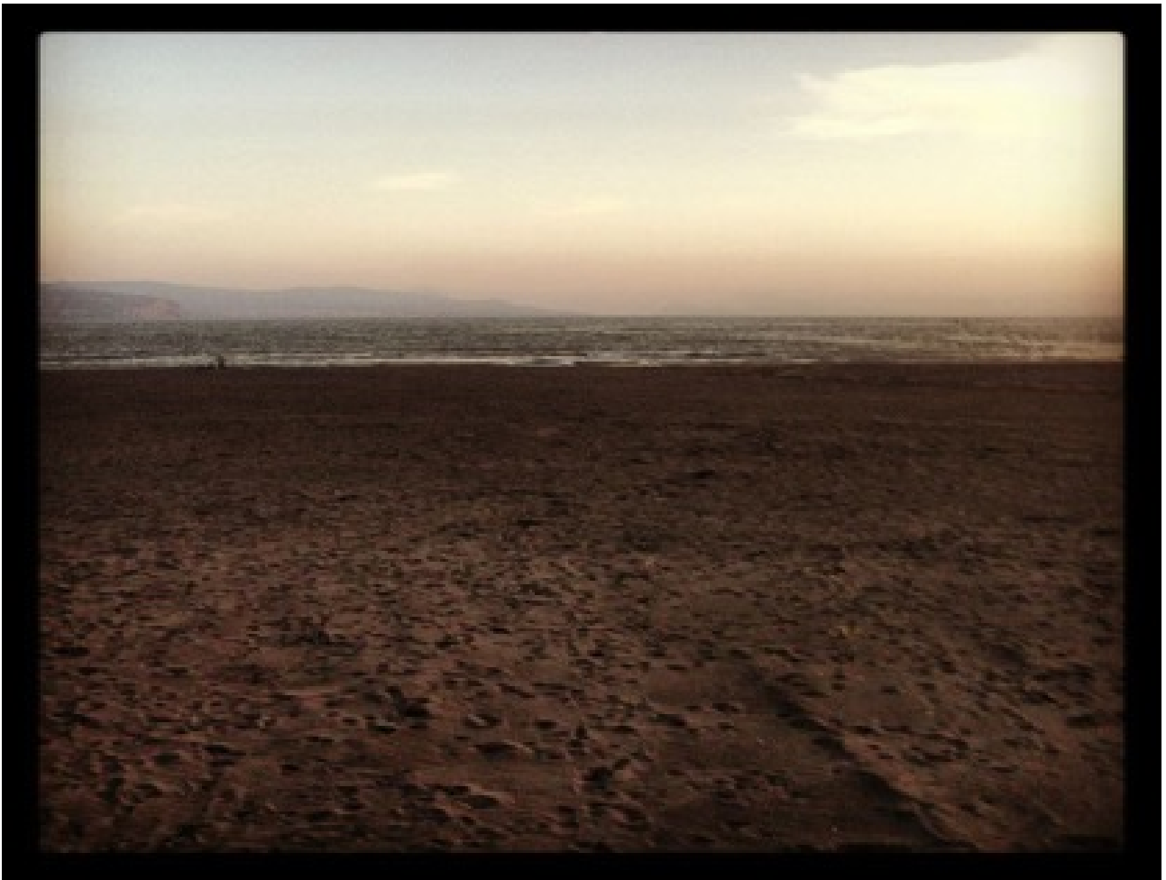
Histoire de lave

Mais, en suivant les traces de la porosité, j'aimerais me concentrer maintenant sur un autre récit, complémentaire à celui recueilli par les archéologues. Dans ce récit intra-actif, l'alternance du plenum et du vide — en termes de corps, de mémoire et de cognition — permet de mieux comprendre « l'interaction émergente » des forces en action dans l'évènement de 79 av. J-C.