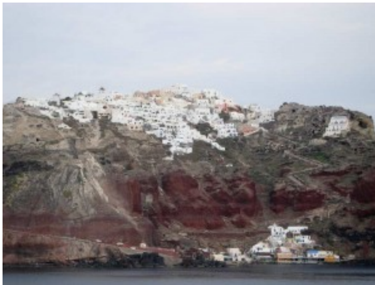
Architecture et paysage dans l'île de Santorin (Grèce)

Accélérons un peu notre parcours en Méditerranée: mesures en pierres volcaniques de Santorin, villages minéraux de l'Épire, Trulli des Pouilles, architecture de terre au Maroc, capitelles et fermes de Haute Provence... L'architecture vernaculaire offre de nombreux exemples en Méditerranée, d'une relation sensible entre l'être humain et la Terre par laquelle l'Homme habite au monde. Plus qu'ailleurs peut être, l'Homme a su composer avec son milieu pour produire un habitat en accord avec le paysage, comme le souligne André Ravéreau à propos du M'zab 16 . Que se cache-t-il derrière cette architecture ?