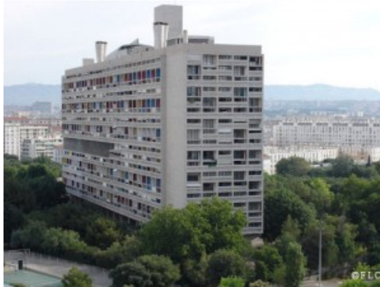
La cité radieuse de Marseille

On remarque bien ici l'idée de séparation par rapport à une nature, un environnement extérieur, considéré comme objet. Cependant, cette déclaration ne doit pas focaliser notre attention sur la personne de Le Corbusier. La fonctionnalité de l'espace, l'emploi du standard, la discordance entre bâti et site nous renseignent plus sur un contexte conceptuel propre à une époque que sur une intention originale et subjective. Chaque individu, chaque habitat est amené à devenir un point égal parmi tant d'autres et le bâtiment perd son lien à l'environnement, son sens paysager. C'est toute la pensée moderne qui se reflète dans ce mouvement: croyance dans le progrès, domination d'une nature devenue ressource ou support, domptage de l'incontrôlable, du fluctuant, rationalisation de la moindre parcelle, négation du vide et du chaos. Car si le bâtiment s'est dégagé de son inertie contextuelle, de son éminence territoriale, c'est pour se reterritorialiser comme standard, œuvre sélectionnée par les temps, fatalité transcendante.