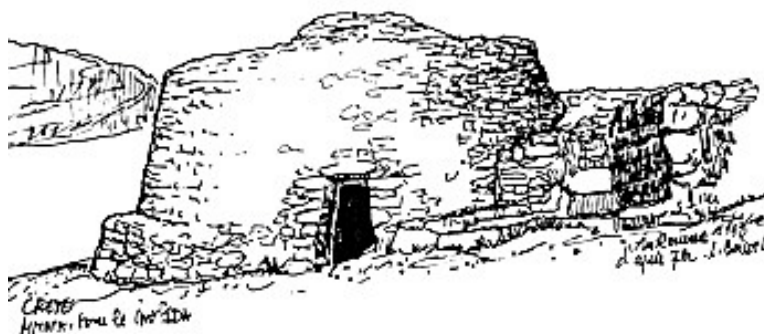
Croquis d'une maison primitive sous le Mont Ida (Crète)

Le repos implique une tranquillité, un bien-être, un espace et par là un temps à l'écart de l'agitation du monde. La demeure a donc d'abord pour fonction de recueillir, de ménager. C'est un lieu de retrait, d'écart qui permet un autre usage du temps. Lévinas nous le dit mieux qu'un autre: