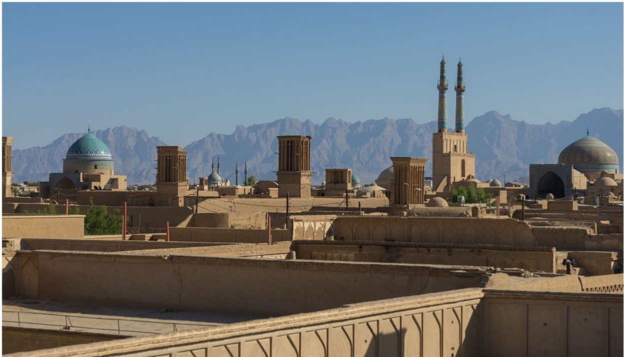
Les tours à vent de Yazd (Iran)